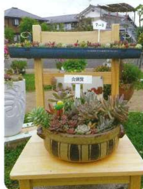
綾部商工会議所会頭賞 受賞作品(令和4年度)