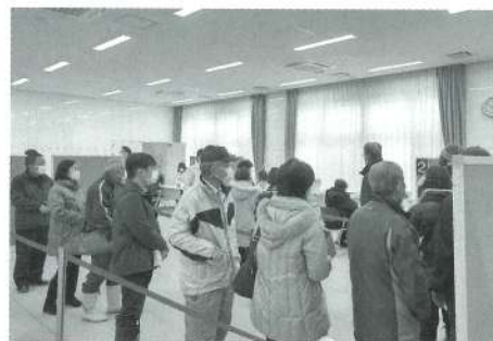
直接販売会場の様子