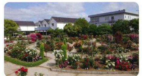
展望台からのバラ園